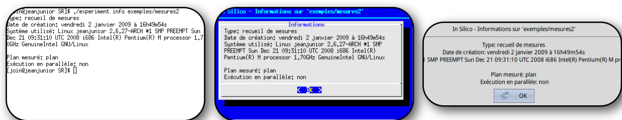
Figure 1 : Trois interfaces pour la même commande.

Si aucun choix n'est forcé, le programme déterminera l'affichage qui fonctionne le mieux sur la machine client. Le choix peut être forcé en modifiant la variable d'environnement DIALOG , qui est soit vide (pas d'utilisation d'un